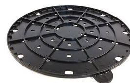
Korektor sklonu pro terče s pevnou hlavou